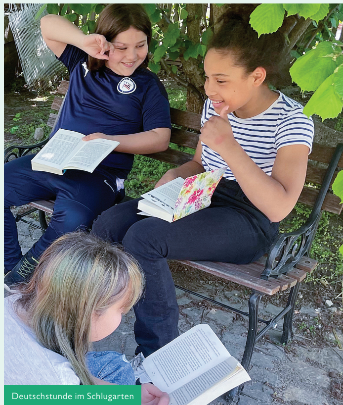
Deutschstunde im Schlugarten

Basierend auf der Methode der Pädagogin Helen Parkhurst wird der Unterrichtsalltag an unserer Schule durch feste, auf selbstbestimmtes Arbeiten ausgerichtete Lernzeiträume aufgelockert.