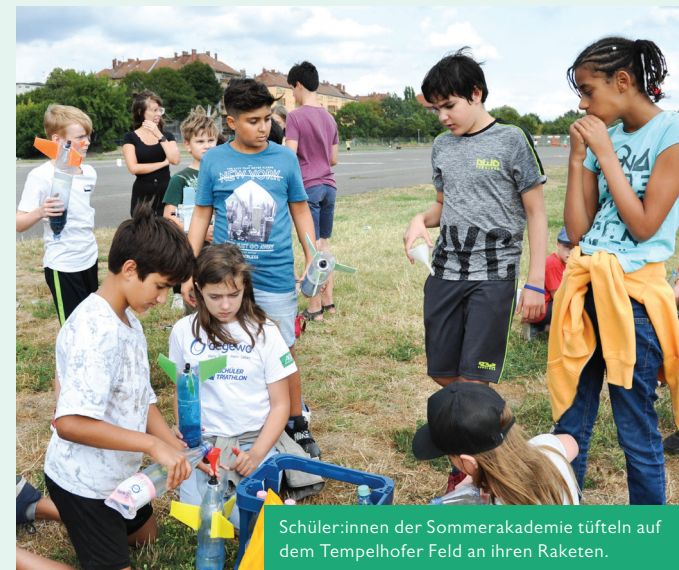
Schüler:innen der Sommerakademie tüfteln auf dem Tempelhofer Feld an ihren Raketen.