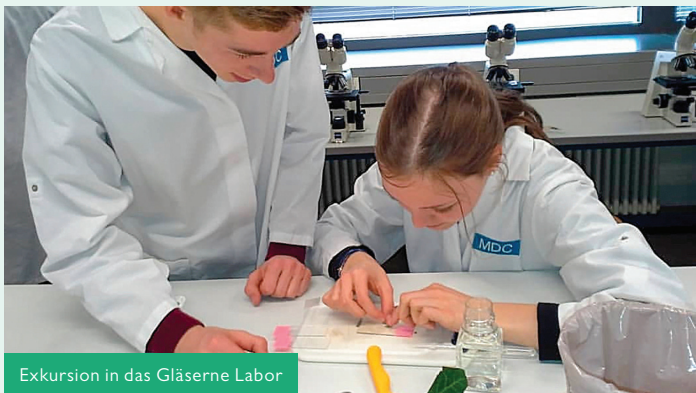
Exkursion in das Gläserne Labor